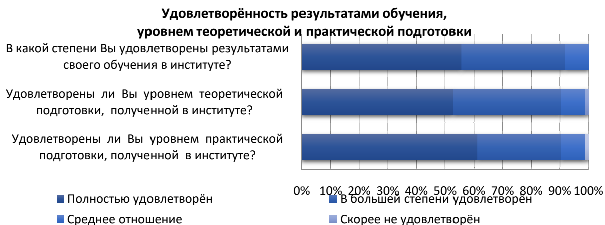
Рисунок 3 – Удовлетворённость выпускников результатами обучения, уровнем теоретической и практической подготовки

Результаты ответов на вопросы о степени удовлетворённости выпускников результатами обучения, уровнем теоретической и практической подготовке представлены в нижеследующей диаграмме (Рисунок.3).