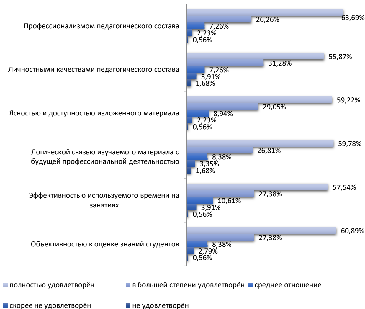
Рисунок 2 – Удовлетворённость студентов профессорско-преподавательским составом

По сумме всех показателей совокупность ответов «полностью удовлетворён», «в большей степени удовлетворён» и «среднее отношение» обобщённый результат степени удовлетворённости составил 96,00%, по совокупности ответов «скорее не удовлетворён» и «не удовлетворён» обобщённый результат составил 4,00%.